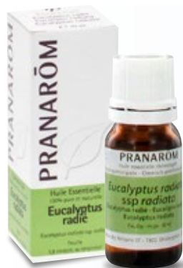
3 PRANARÔM Huile Essentielle Eucalyptus Radiata 10 ml