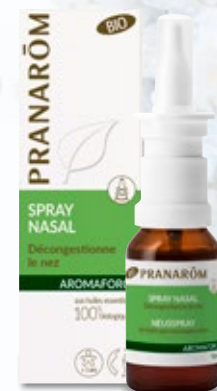
4 PRANARÔM Aromaforce Spray Nasal 15 ml