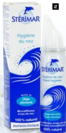
STÉRIMAR Hygiène du Nez 100 ml