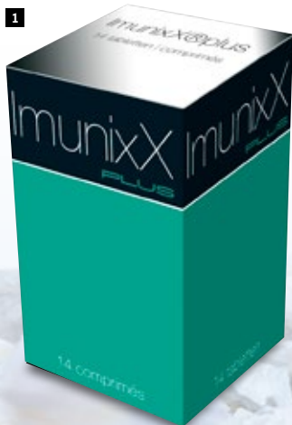
IMUNIXX PLUS 14 comprimés