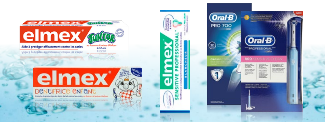
Dentifrices ELMEX® Junior Professionnel, Junior classique et Enfant

Une brosse à dents devrait être changée tous les 3 mois ou dès que les poils commencent à se courber. Afin d'atteindre tous les espaces interdentaires, il est recommandé d'utiliser le fil dentaire et les brossettes interdentaires .