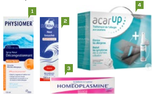
1. Physiomer® Sinus 135 ml | 2. Stérimar® Hypertonique 100 ml 3. Homeoplasmine® 40 gr | 4. Acar'Up® Kit Familypack (2 x 100 ml + 2 supports)